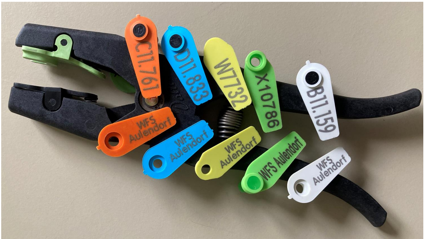
Abbildung: Im Projekt Rehwildmarkierung verwendete Ohrmarken

Das Projekt ist dringend auf die Unterstützung durch die Jägerschaft angewiesen. Zum einen natürlich bei der Markierung der Kitze, aber ebenso wichtig ist die Meldung markierter Rehe oder von Markenfundern. Die Marken die im Projekt verwendet werden, tragen auf einem Markenflügel die Aufschrift WFS Aulendorf und auf dem anderen Markenflügel einen Buchstaben, gefolgt von einer eindeutigen Nummer (siehe Abbildung). Es werden insgesamt fünf unterschiedliche Farben für die Marken verwendet. Dies soll die Altersbestimmung in der freien Wildbahn ermöglichen.