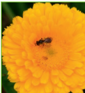
Bienengefährliche Mittel dürfen nicht auf blühende Pflanzen ausgebracht werden